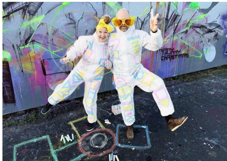
Hinkerude workshop I 2022.

Ligeledes er der tradition for at Faster Cool optræder med en ny event eller workshop i Børnekulturfestivalens program. Hvad der bliver i 2023 er endnu ikke endeligt besluttet.