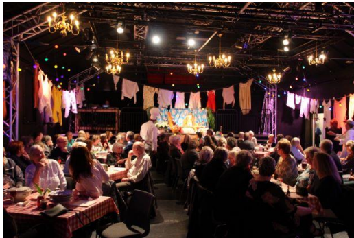
Kultursuppe 2019.

Først serverer Dansk Rakkerpaks & FASTER COOLS kultursuppe-crew en uforskammet god gang suppe og gennemfører undervejs diverse ritualer med publikum. Bagefter serveres hovedretten – et show eller en forestilling med forskellige gæsteoptrædende – lejlighedsvis hentet fra udlandet.