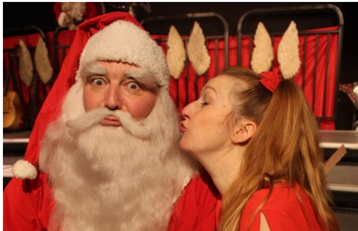
Faster Cool og julemanden 2018.

Faster Cool juletræsfest har været på programmet gennem alle vores år som egnsteater, men måtte pga. Covid19 aflyses i både 2020 og 2021. Det er en meget populær event. I 2023 forventer vi at afholde 2 juletræsfester.