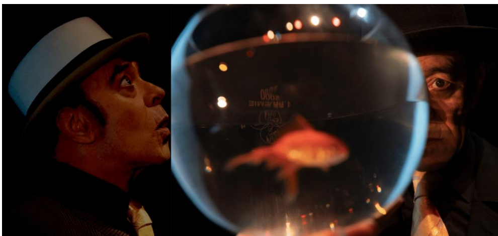
"Livets små mirakler"/Paolo Nani. Spiller i Teatersalen 14. feb. 2023

Billetter købes hos Næstved Teater (teaterforening i Næstved).