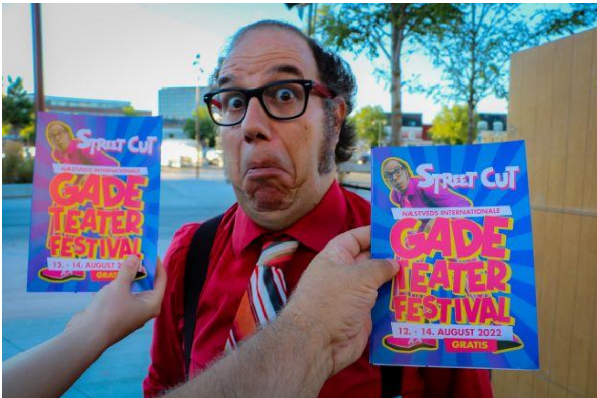
Pera Hosta fra Spanien.

I forbindelse med de internationale kompagnier samarbejder vi med diverse andre festivaler for at være flere om den dyre transport og kunne nedsætte klimaaftrykket, men først og fremmest for at kunne få topartister til Næstved. I 2023 samarbejder vi bl.a. med: PASSAGE i Helsingør, Bornholms internationale Gadeteaterfestival og Halmstad Gadeteaterfestival (Sverige).