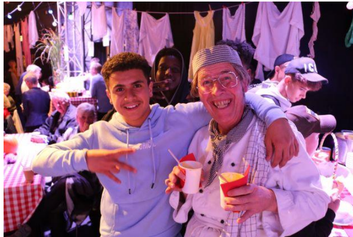
Kulturnat 2022.

Siden 2017 har vi hvert år under kulturnatten holdt åbent hus i Teatersalen og vi vil igen invitere børn og voksne ind i teatersalen til suppe, komik og musik i ægte forsamlingshusstemning. For nogle er dette deres første møde med egnsteatret, men sjældent det sidste!