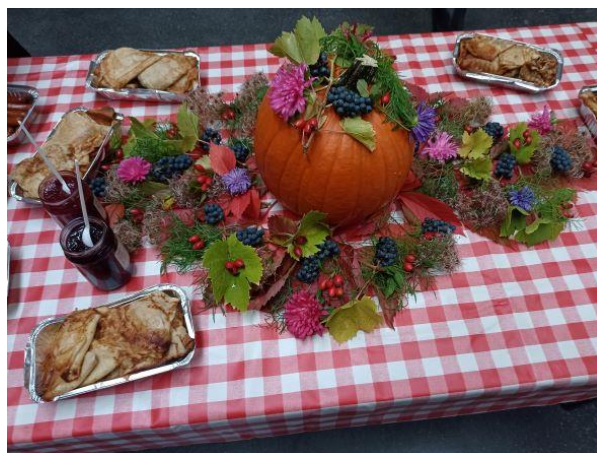
Børneteaterbrunch oktober 2022.

Vi fortsætter samarbejdet med Næstved Teater og Kulturcentret omkring børneteaterbrunch. Arrangementerne ligger i hovedreglen på den første søndag i måneden. Først spilles teater i vores teatersal kl. 11 og derefter indtages brunchen i kulturcenterets store foyer.