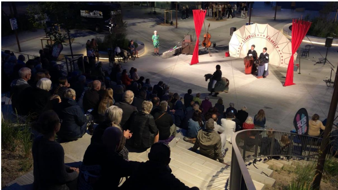
Åbningskabaret på DRÅBEN 2021. På scenen franske Les Goulus.

I forbindelse med de internationale kompagnier samarbejder vi med diverse andre festivaler, herunder: PASSAGE og Smuk Fest.