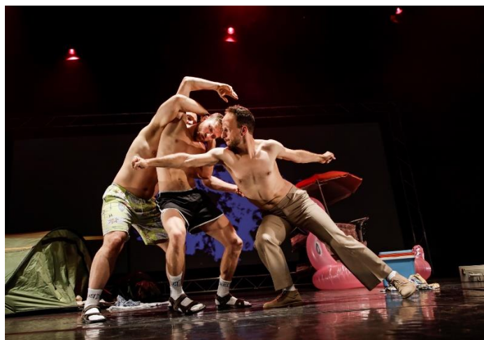
"Turist" af Don Gnu.

I 2022 vil Næstved Teater - udover Børneteaterbrunch-forestillingerne - lejlighedsvis spille børneteaterforestillinger og smalle voksenforestillinger i vores sal i weekender og om aftenen. Omfanget kendes pt. ikke. Vi arbejder sammen om de "Smalle voksenforestillinger".