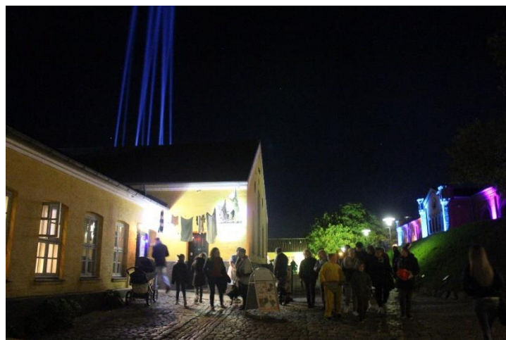
Kulturnat 2017.

Vi vil igen invitere børn og voksne ind i teatersalen til suppe, teater og musik i ægte forsamlingshusstemning. For nogle er dette deres første møde med egnsteatret, men sjældent det sidste!