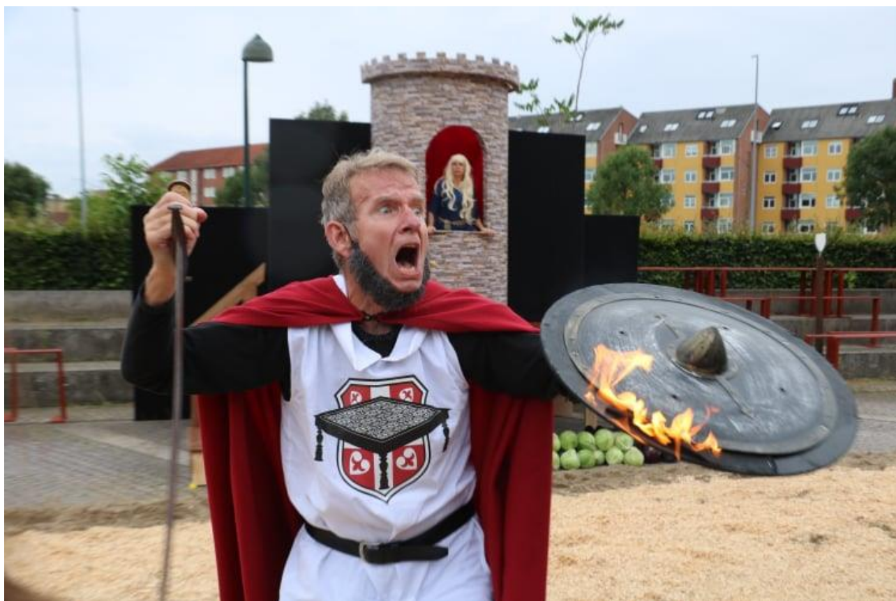
Fra "Dragen er løs" under Næstveds Søjler.