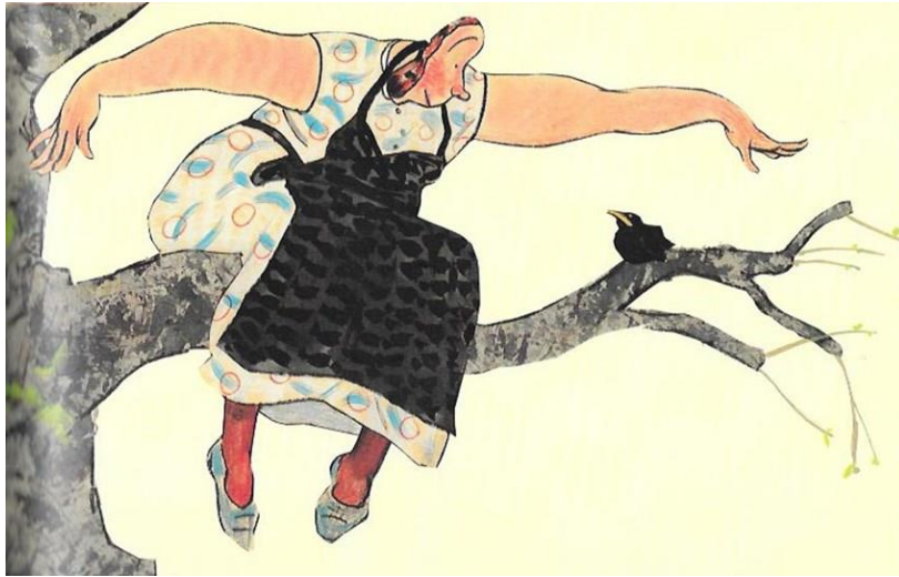
Solsorten med Teater Patrasket, der spillede til Børneteaterbrunch i oktober 2021

Wauw er navnet på den kommunale indkøbsordning af teater for aldersgruppen 2 år – 10. klasse. Det er børnekulturkonsulenten, der sammen med et lille udvalg indkøber forestillingerne. Repertoiret koordineres med Næstved Teater og Dansk Rakkerpak & FASTER Cool og vi indgår som regel i programmet med en eller flere forestillinger. Vi kommer desuden hvert år med anbefalinger til programmet. Der spiller ca. 50 forestillinger i Teatersalen.