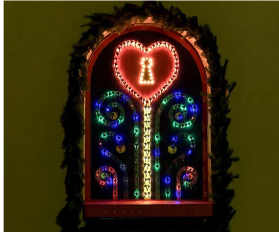
Faster Cools nye julevindue, 2021.

Årets vinduesudstilling ved teatret afsløres igen ved en lille ceremoni sidst i november/først i december. Bagefter spiller årets juleforestilling og afslutningsvis serveres risengrød. Vinduerne kan beskues hele december måned.