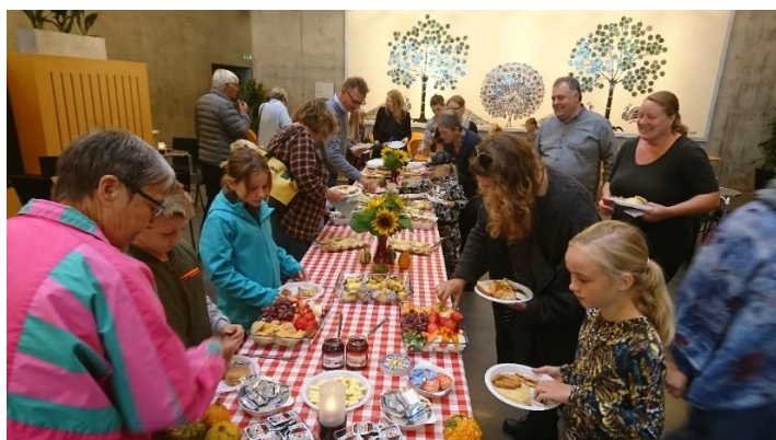
Børneteaterbrunch oktober 2018.

Vi fortsætter samarbejdet med Næstved Teater og Kulturcentret omkring børneteaterbrunch. Arrangementerne ligger i hovedreglen på den første søndag i måneden. Først spilles teater i vores teatersal kl. 11 og derefter indtages brunchen i kulturcenterets store foyer.