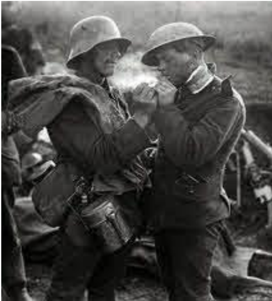
Tysk og engelsk soldat deler ild under Julefreden