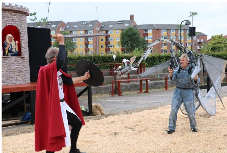
Sct. Niels kæmper mod dragen: Borgmesterens datter Næstina ser bekymret til.

Festivalen er desværre flyttet fra august til juni i 2022. Det betyder at vi ikke har mulighed for at deltage med "Dragen er løs", der blev skabt direkte til festivalen i 2021 og skulle have spillet igen. Men måske kan Sct. Niels, Ridder af det rektangulære Kakkelbord og han tro væbner Balder deltage i festivalens startoptog og senere som et improviseret forløb kæmpe mod alt og alle på festivalpladsen som en anden Don Quixote (og Sancho Panza)