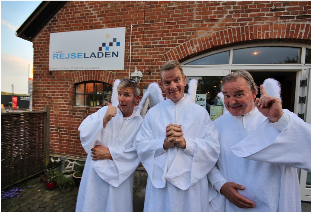
Lus i Skindpelsen - holdet foran Rejseladen i Glumsø, der blev kåret som årets arrangør på "Tour de Næstved i 2019.