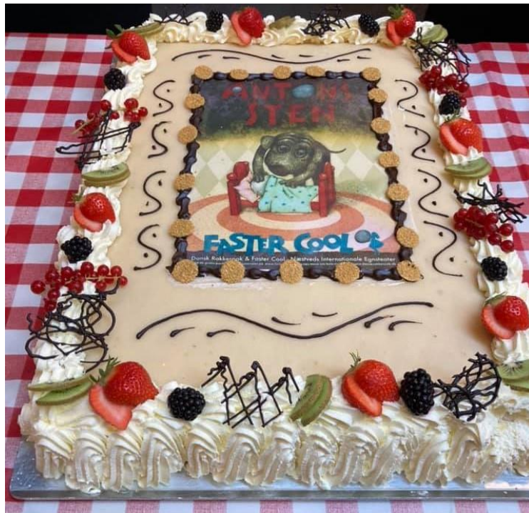
Premierekagen inden udskæring.