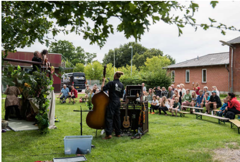
"Tour de Næstved ved Korskilde Bibliotek i Tappernøje.

Er et initiativ som Dansk Rakkerpak & FASTER Cool har taget for at sikre at Næstveds internationale egnsteater også kommer helt ud i kommunens små byer og afkroge, så publikum ikke altid skal ind til centrum for at møde hele kommunens egnsteater. Under devisen "Hvis Mohammed ikke vil komme til bjerget, må bjerget komme til Mohammed" vil Dansk Rakkerpak og FASTER Cool igen i 2021 tilbyde diverse lokale aktører en gadeteaterforestilling eller gadeevent.