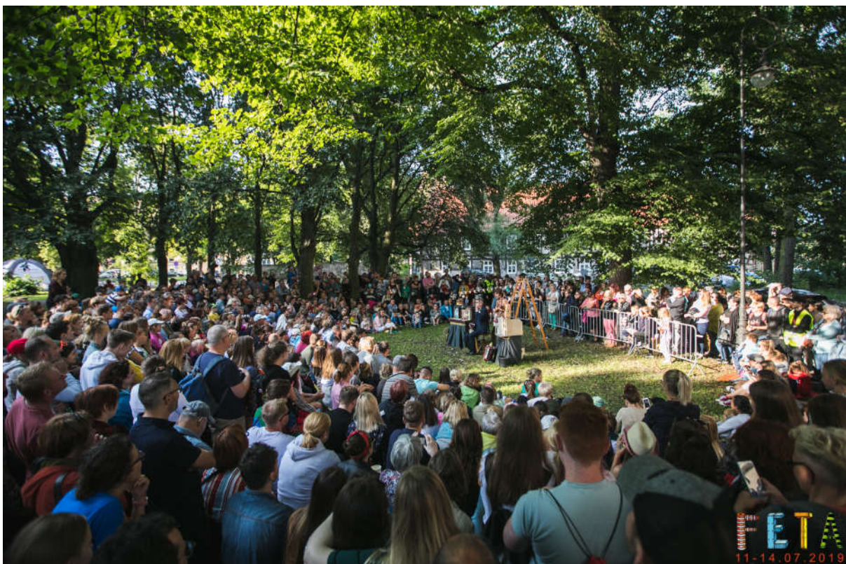
Feta Festival, Gdansk, Polen.

De to komedianter har lige siden de mødtes leget med at udfordre hinanden i forhold til livets små og - store spørgsmål. Og da instruktøren Niels Grønne pludselig kunne se en forestilling i denne leg, blev det til et unikt internationalt teatersamarbejde!