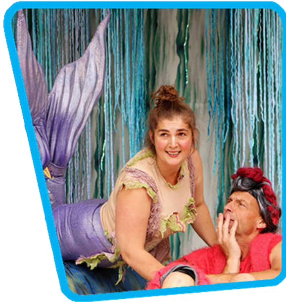
Den Lille Havfrue af teatret Fyren og Flammen. Teatersalen okt. 2020.

Wauw er navnet på den kommunale indkøbsordning af teater for aldersgruppen 2 år – 10. klasse. Det er børnekulturkonsulenten, der sammen med et lille udvalg indkøber forestillingerne. Repertoiret koordineres med Næstved Teater og Dansk Rakkerpak & FASTER COOL og vi kommer hvert år med anbefalinger til programmet. Der spiller ca. 50 forestillinger i Teatersalen. Vores egen "Antons Sten" kommer til at indgå i repertoiret for 2021.