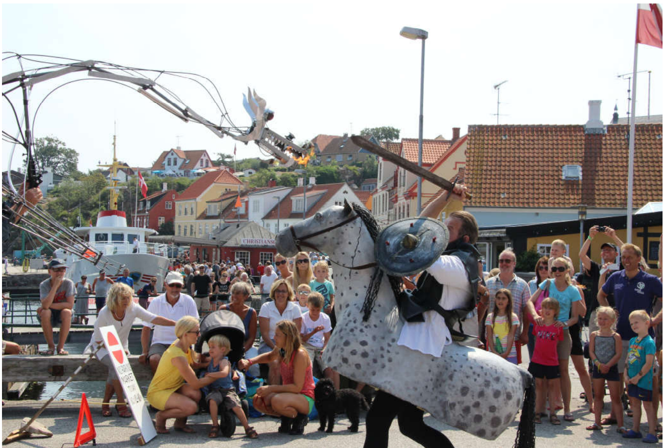
Sct. Niels kæmper mod dragen i Gudhjem på Bornholm