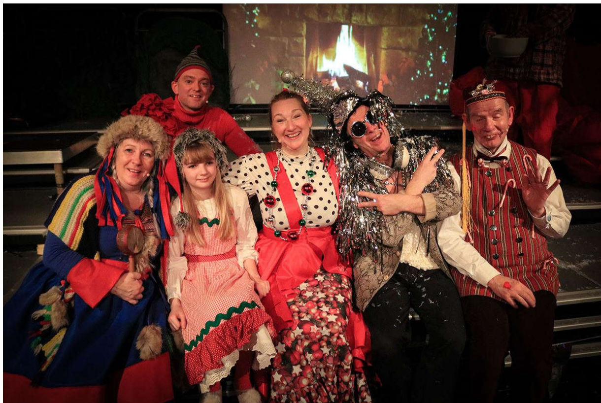
Ensemblet til Faster Cools Juletræsfest 2019.

Denne aktivitetsplan skal tages med "et gran salt"- forstået på den måde at vi lige som landets øvrige kulturudbydere selvfølgelig må tilpasse vores aktiviteter i forhold til hvordan COVID-situationen udvikler sig og ud fra hvilke restriktioner og anbefalinger der måtte komme fra myndighedernes side i løbet af 2021.