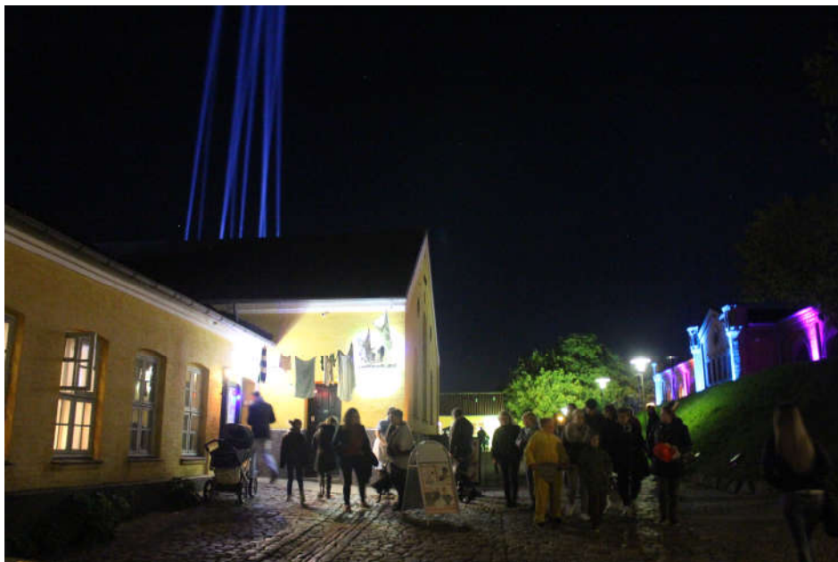
Kulturnat 2017.

Vi håber igen i 2021 at kunne invitere børn og voksne ind i teatersalen til suppe, teater og musik i ægte forsamlingshusstemning. For nogle er dette deres første møde med egnsteatret, men sjældent det sidste!