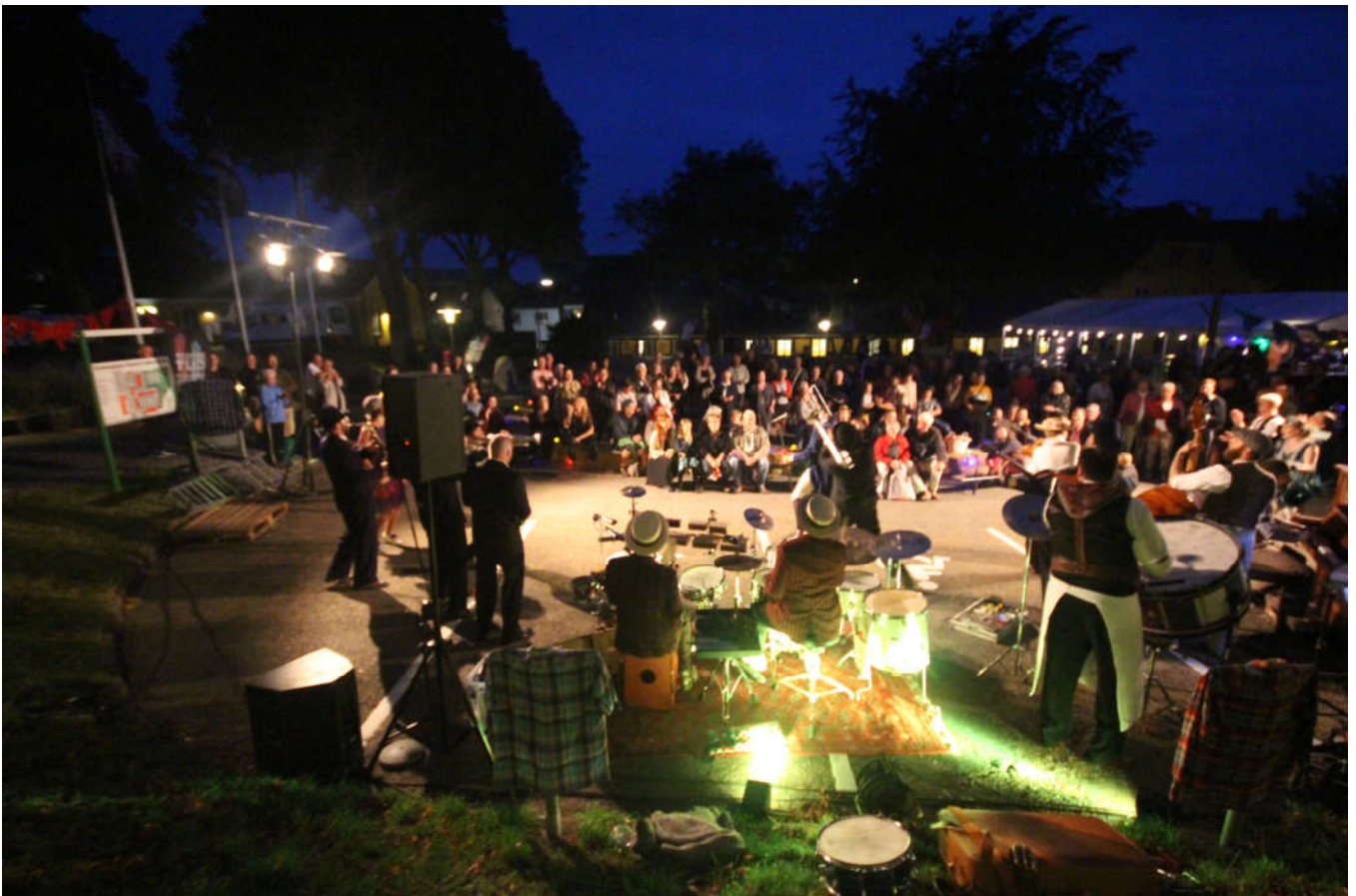
STREET CUT, 2019. Zirkus med 17 musikere og dansere.

4. udgave af STREET CUT finder sted fre. d.20. – søn. d. 22. august 2021.