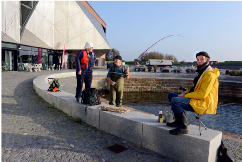
"Fiskere" til Klimamøde i Helsingør