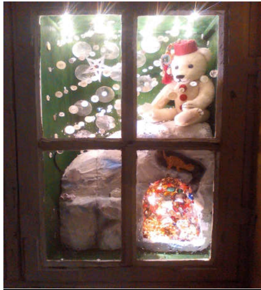
Ét af Faster Cools julevinduer.

Årets vinduesudstilling ved teatret afsløres igen ved en lille ceremoni sidst i november/først i december. Bagefter spiller årets juleforestilling og afslutningsvis serveres risengrød. Vinduerne kan beskues hele december måned.