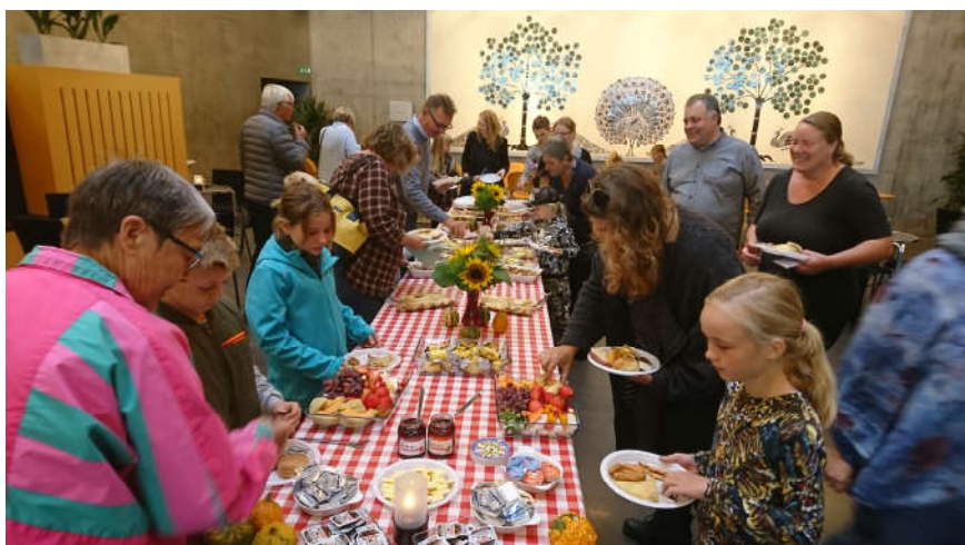
Børneteaterbrunch oktober 2018.

Der "serveres" børneteaterbrunch 5 -6 gange i løbet af året.